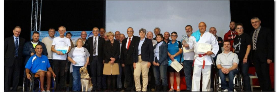
Photo de famille en guise de conclusion de cette brillante manifestation qui a sensibilisé une nombreuse assistance sur la nécessité d'améliorer les accessibilités aux personnes en situation de handicap qui ne demandent pas à être considérées comme des « gens différents »

Peu avant midi, les trophées et récompenses ont été décernés aux bénévoles méritants qui se dévouent sans compter pour apporter du mieux-être aux personnes en situation de handicap. Parmi le nombreux public, le collège Jean Monnet de Gruchet-le-Valasse a permis à deux classes de venir à ce colloque. Les élèves se sont prêtés au jeu en expérimentant des épreuves destinées aux handicapés et se sont rendus compte des difficultés auxquelles ils sont confrontés au quotidien.