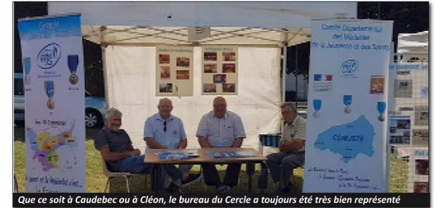
Que ce soit à Caudebec ou à Cléon, le bureau du Cercle a toujours été très bien représenté